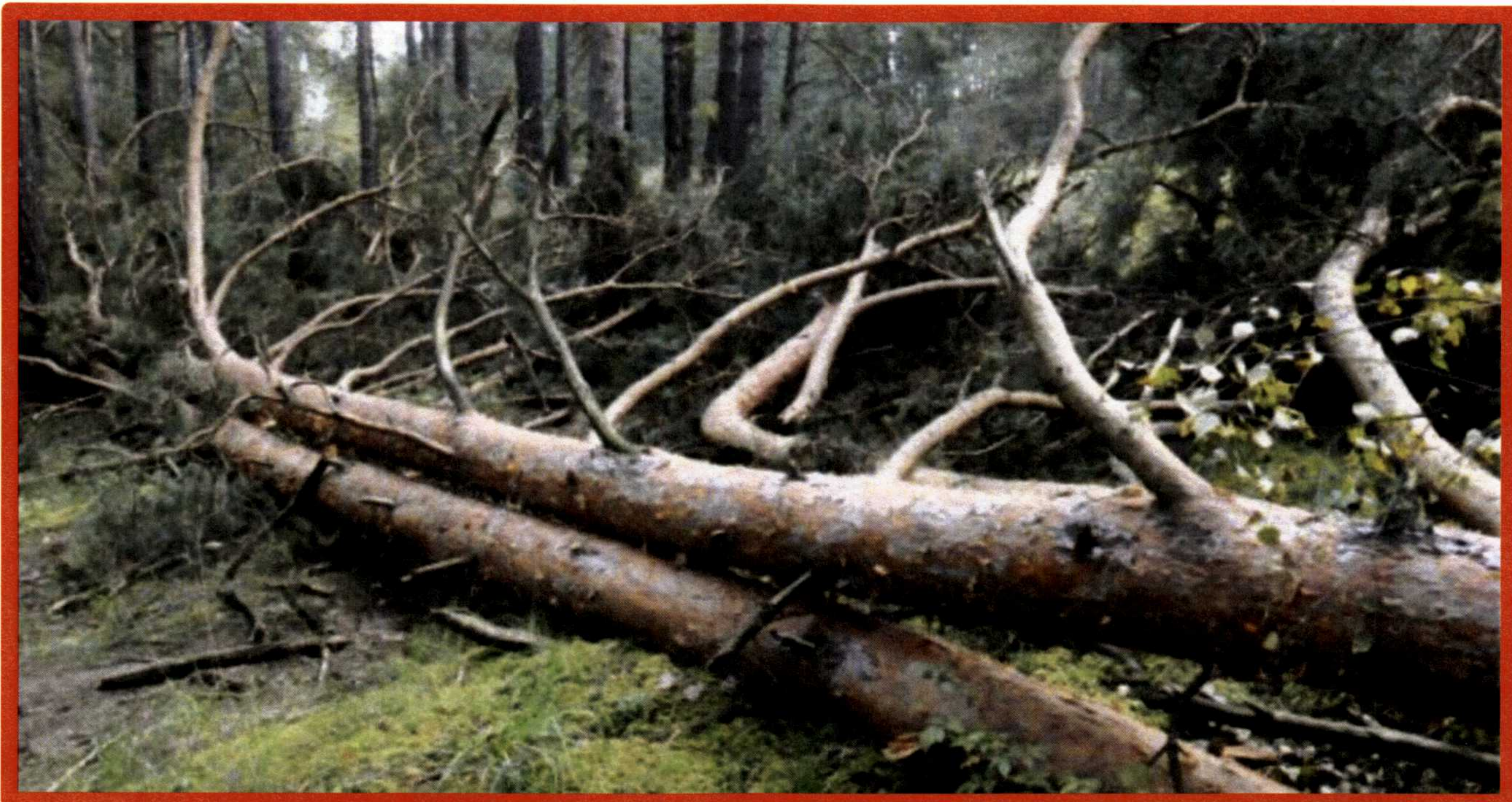
Лежащее на поверхности земли ветровальное дерево, не имеющее признаков отмирания. Не является валежником

Кроме того, необходимо обратить внимание, что деревья, которые лежат на земле, но не имеют признаков естественного отмирания (имеют зеленую листву или хвою), определять как «мертвые» не допускается (смотри изображение № 5).