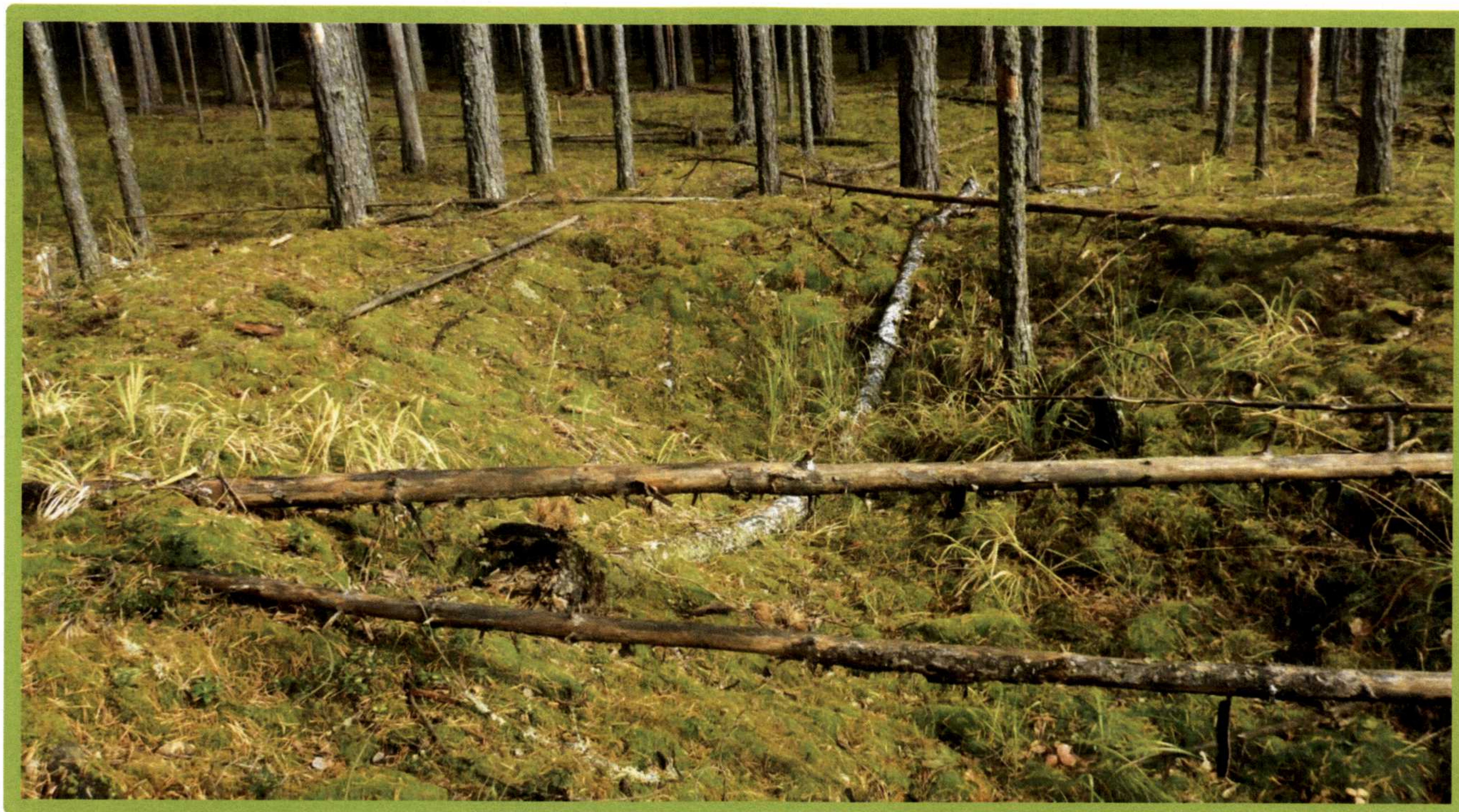
Изображение № 1 Валежник

Примеры валежника (смотри изображения №№ 1,2,3).