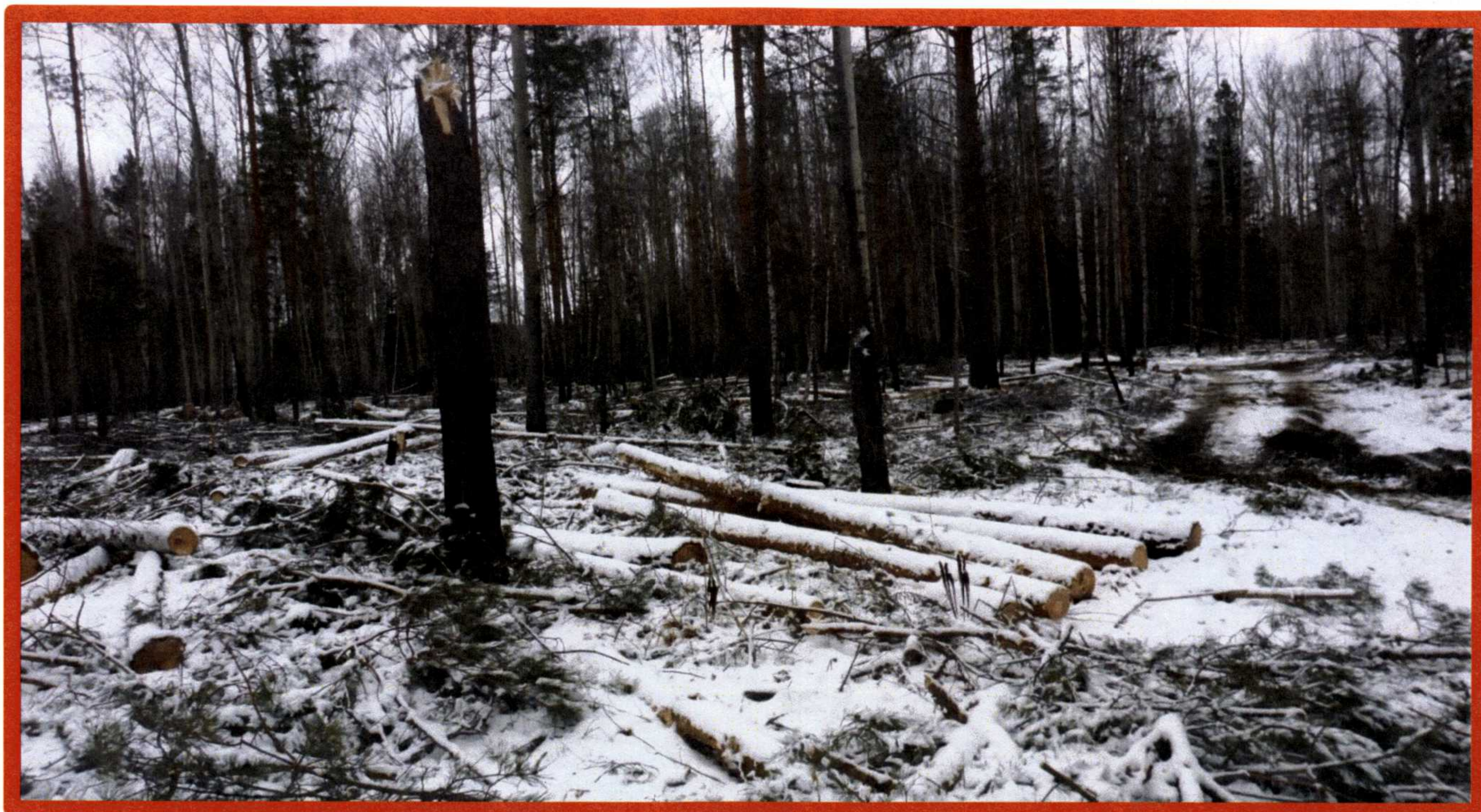
Изображение № 7 Брошенная древесина вдоль лесовозных дорог. Не является валежником