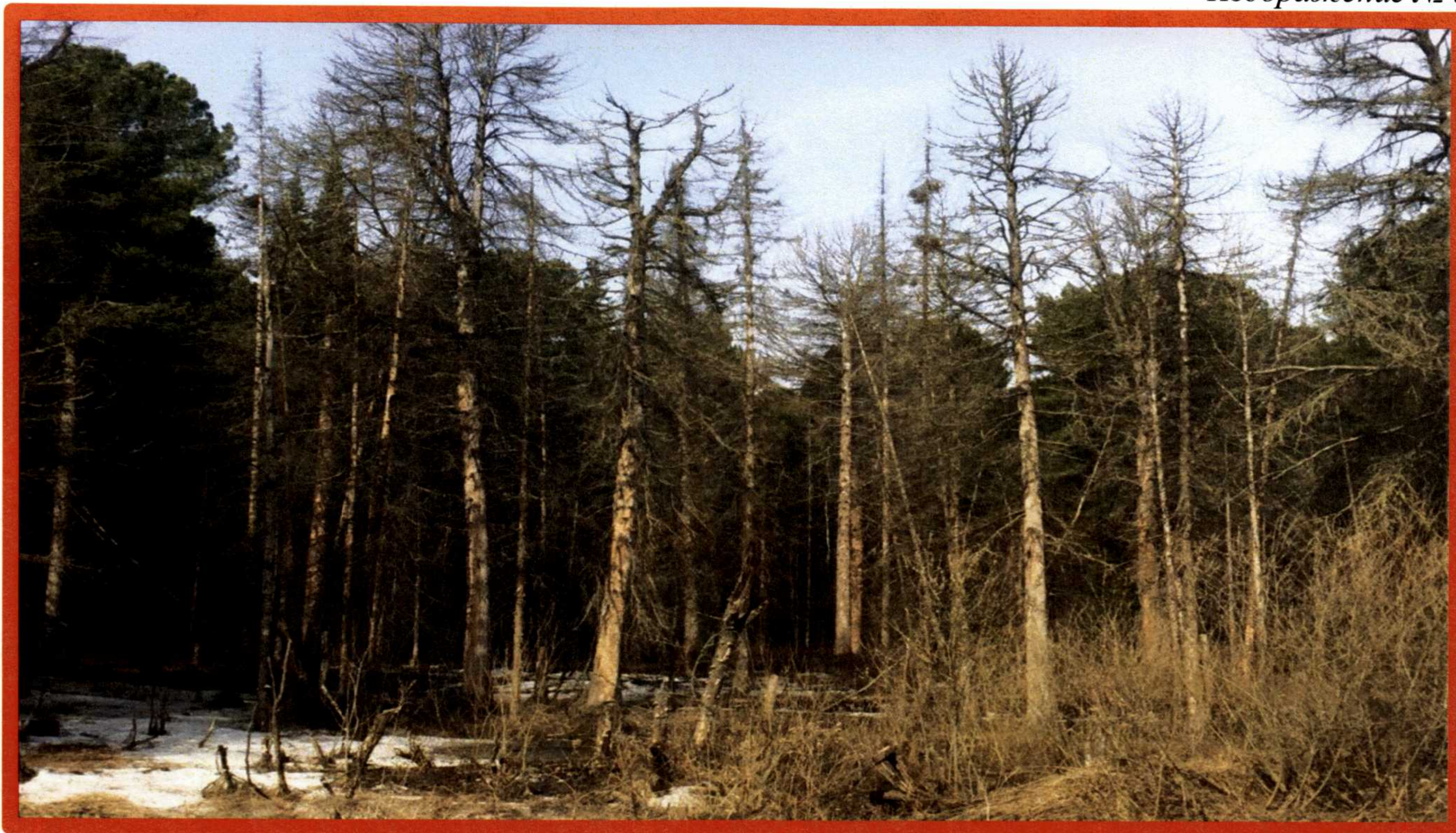
Изображение № 4 Сухостойное дерево. Не является валежником Изображение № 5

Кроме того, необходимо обратить внимание, что деревья, которые лежат на земле, но не имеют признаков естественного отмирания (имеют зеленую листву или хвою), определять как «мертвые» не допускается (смотри изображение № 5).